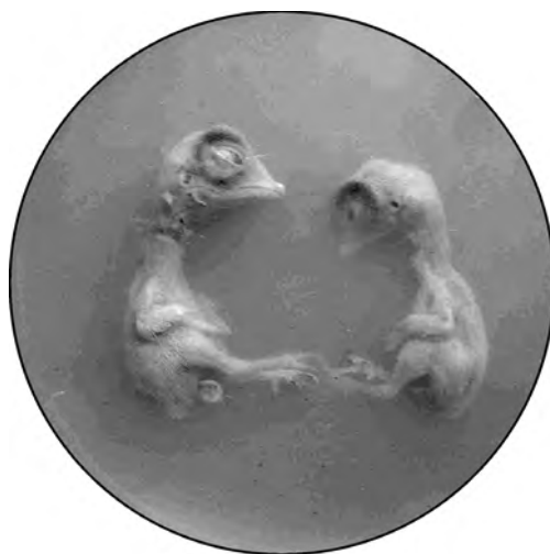
Рис. 2. Куриный эмбрион. Фиксация ПГМГ. Препарат в агаре

Для изготовления препаратов использовались 5 куриных эмбрионов поздних сроков развития. Опыт поставлен в апреле 2007 г. Эмбриональные ткани содержат высокий процент воды и незрелый коллаген, поэтому легко подвергаются микробной деградации. Объекты предварительно промывались дистиллятом, затем заливались консервантом и выдерживались при комнатной температуре в течение 7 сут. в плотно укупоренной таре. Проводилась периодическая проверка изменения органолептических свойств органа и фиксирующей жидкости. По истечении срока бальзамирования два экземпляра эмбрионов мы залили плотной средой следующего состава: вода — 400 мл, агар Difco — 15 г, раствор ПГМГ 1 % — 100 мл (рис. 2). Тела трех других эмбрионов были помещены в 1 % раствор ПГМГ без предварительного инъектирования, хранились в негерметично закрытом сосуде. Через 10 месяцев после бальзамирования при осмотре препаратов существенных изменений внешнего вида эмбрионов не выявлено, раствор испарился, и препараты долгое время оставались «сухими». После осмотра произведено ребальзамирование. Препараты помещены в консервант следующего состава: раствор NaCl 0,9 % — 30 мл, насыщенный раствор ПГМГ, полученный предельным растворением кристаллического вещества в течение суток ( t = 37^\circ\text{C} ) — 70 мл, спирт этиловый 96 % — 10 мл. Предварительно произведены инъекции агара Difco (3 г на 100 мл воды) в несколько спавшиеся глазные яблоки эмбрионов для восполнения объема.